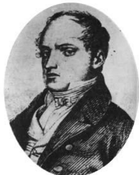
Краснописание“ и др.

Той извършва апостолска работа, като привлича много българи, за да се разраства образованието сред българите. Внесена е свършено нова образователна идея, а именно за девическото образование. Появява се и идея за централизирано управление на обучението в страната- идея, изключително необходима за това време. За да я превърне в реалност, Петър Берон пътува с лични средства в цялата страна и я разпространява. Берон е изключително всеотдаен и загрижен за родното образование. Това доказва и фактът, че още докато е жив завещава жилището си и всичко, което има за нуждите на образованието. За времето на Възраждането, Берон е първият български педагог с ясни теоретични възгледи за образованието. Те оказват демократизираща роля за цялостното образование и поставят началото на традиции, които успешно битуват до днес в родното училище. Неповторимият принос от творчеството и дейността на Берон са във връзка с изключително активната му практическа и свършено компетентната му теоретическа изява. Оставеното от него литературно наследство е в различни области /педагогика, физика, химия, философия, медицина, астрономия/, на много езици /български, френски, латински, гръцки, немски /се откроява с новаторски идеи. Някои от произведенията на Берон са: Система на атмосферологията“, Система на геологията и произхода на кометите“, Славянска философия“,